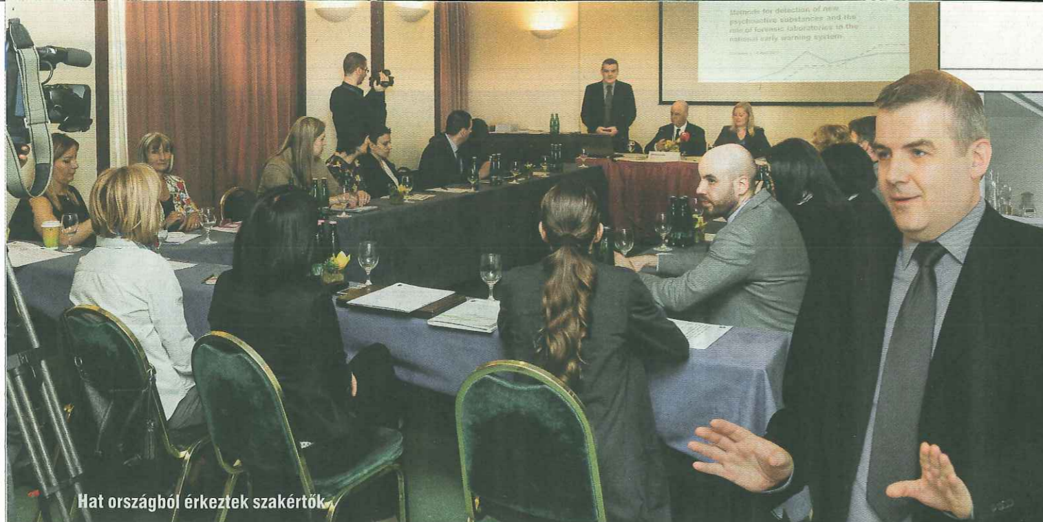
Hat országból érkeztek szakértők